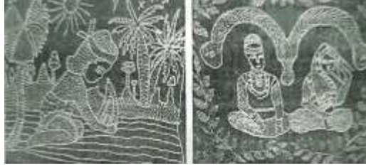
চিত্র ৫: নকশি ওয়াল ম্যাট

সম্প্রতি যশোর অঞ্চলে ব্যাপকভাবে ওয়ালম্যাট তৈরি হচ্ছে। বাংলাদেশের বাইরে এর বিস্তার চাহিদা রয়েছে। নতুন কাপড়ের জমিনের নান্দনিক বিভিন্ন চিত্র জীবন্ত করে কারিগররা ওয়াল তৈরি করেন। এ ক্ষেত্রে গ্রাম বাংলার চিরচেনা দৃশ্য, নিত্য ব্যবহার্য দ্রব্য সামগ্রীর নকশা ইত্যাদি প্রাধান্য পায়। ১৫ একজন সাধারণ কারিগরের তত্ত্বের বুনন ফ্রেমে বন্দি হয়ে শেষ পর্যন্ত ওয়ালম্যাটটি বিভবানের রংচি ও আভিজাত্যের প্রতীক হিসেবে ড্রয়িং রুমে শোভা পায়।