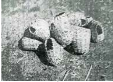
চিত্র ৯: পাখির বাসা।

যশোর সদর থেকে প্রায় ছয় কিলোমিটার দূরে অবস্থিত জমিপাড়া, বাহদুরপুর। এখানে বাঁশ দিয়ে তৈরি করা হয় কুটির শিল্পের অসাধারণ নিদর্শন হিসেবে পাখির বাসা। ২৮ এছাড়াও রয়েছে ফুলদানি, তাক, চাঙারী প্রভৃতি। হিন্দু সম্প্রদায়ের কয়েকজন সাধারণ মানুষ তাদের শৈল্পিক দক্ষতার কারণে এখানে অনেকের কাছ হয়ে উঠেছেন অসাধারণ। তাদের তৈরিকৃত পাখির বাসা একদিকে যেমন ঘরের শোভাবর্ধক, অপরদিকে পাখির জন্য নিরাপদ আশ্রয়স্থল। এটি পরিবেশ রক্ষারও উপায়। দক্ষিণবঙ্গের প্রাকৃতিক দুর্যোগের কবল থেকে পাখিদের রক্ষার জন্য এটি অনেকটাই স্থায়ী আবাসস্থল হিসেবে পরিগণিত। বাসার নির্মাণ প্রক্রিয়া সরল প্রকৃতির। অনেকটাই গরুর ঠুঁসির আদলে তৈরি করা হয়। ফলে পাখিদের নিরাপদে বসবাস ও প্রজননের সুবিধা হয়। উল্লেখ্য যে, এখানে তৈরিকৃত পাখির বাসা, কলস, ফুলদানি, পটল ফুলদানি বিদেশে রপ্তানি করা হয়। ২৯