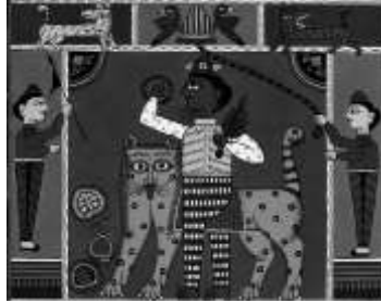
চিত্র ১: গাজীর পট

যশোরের গ্রামীণ অঞ্চলে পটচিত্র বিনোদনের এক উল্লেখযোগ্য মাধ্যম হিসেবে বিবেচিত। এ শিল্পেই বাঙ্গালির শিল্পশ্রীতির পরিচয় নিহিত। তাই আজও নর-নারীর সৌন্দর্যের তুলনায় বলা হয় ‘পটের মতো সুন্দর’ আর দেব-দেবীর প্রতিমাকে বলা হয় ‘পটের ঠাকুর।’ ১২ পটে অংকিত ছবি হতে পারে পৌরাণিক কিংবা বিভিন্ন শ্রেণির মানুষের সাধারণ জীবনযাত্রা ও আচার অনুষ্ঠানের ছবি। পট বা কাপড় শব্দ হতে পট শব্দের উৎপত্তি। পটচিত্র অংককারীরা পটুয়া হিসেবে পরিচিত। আবার এদেরকে গণশিল্পী হিসেবেও আখ্যায়িত করা হয়। ১৩ পটুয়ারা সুতী কাপড়ের উপর প্রলেপ লাগিয়ে তার উপর রং দ্বারা নানা ধরনের চিত্র অংকন করেন। এ শিল্প ষোল শতকের পর থেকে ভারতীয় উপমহাদেশে বিকাশ লাভ করে। এ সময় থেকে কৃষ্ণ লীলা, রামায়ণ ও মনসা মঙ্গলের বিভিন্ন কাহিনী নিয়ে পট অংকন শুরু হয়। কিন্তু পরবর্তীতে যম রাজের শাস্তি সম্পর্কিত চিত্রেরও সন্ধান পাওয়া যায়। হিন্দু সমাজের ন্যায় মুসলিম সমাজেও গাজীর পটচিত্রের প্রচলন রয়েছে। হিন্দু পৌরাণিক কাহিনীর অনুকরণে গাজীর কাহিনী অংকন করা হয়। গাজীর পটে তিনটি বিষয়ের সংমিশ্রণ লক্ষ্য করা যায়। তা হলো- গাজীর মহাত্ম ও গুণকীর্তন, সামাজিক হিতোপদেশ ও যম রাজের শাস্তি। ১৪ পটুয়াদের সাথে আধুনিক শিল্পীর পার্থক্য রয়েছে। আধুনিক চিত্রকর্মে শিক্ষার ছাপ থাকে, লোকশিল্পে তা থাকে না। কারণ অধিকাংশ লোকশিল্পীই অশিক্ষিত। তবে তারা সাধারণ মানুষের জীবন-যাত্রাকে ধারণ করে বলে তাদের চিত্রকর্ম সমগ্র গ্রামীণ সমাজের হয়ে ওঠে। বস্তুত: হিন্দু ও মুসলিম সমাজে এক সময়ে পটচিত্র শিল্পের যে কদর ছিল বর্তমানে আধুনিকতার প্রভাবে তা অনেকটাই শ্রিয়মান হয়ে পড়েছে।