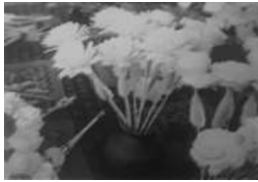
চিত্র ৮: শোলা দিয়ে তৈরি বিভিন্ন ফুল।

যশোরের বিল এলাকায় প্রচুর শোলা জন্মে। শোলা দিয়ে ছোট ছেলে মেয়েদেও খেলনার পুতুল, মুকুট, মালা, চালচিত্র, কমদফুল, টোপার ও নানা ধরনের ফুল তৈরি হয়। তবে ফুল ও টোপার সাধারণত হিন্দুদেও ধর্মীয় ও সামাজিক অনুষ্ঠানে ব্যবহার হয়ে থাকে। হিন্দুদেও বর-কনের বিয়ের আসরের মাথার টোপার ও দেব-দেবীর মাথার টোপার ছাড়াও লোকবিশ্বাসের সাথে সম্পৃক্ত ধানের গোলা ঘটে টাঙ্গানো ফুল শোলা দিয়ে তৈরি হয়। বাসন্তী পুজায়ও শোলার ফুলের ব্যবহার লক্ষ করা যায়। শোলাকে বিভিন্ন আকৃতিতে কেটে নানা রং দিয়ে নান্দনিক শিল্পকর্ম তৈরি করা হয়। যারা শোলা সামগ্রী তৈরি করেন তারা ‘মালাকার’ ২৫ হিসেবে পরিচিত। যশোর জেলার দক্ষিণ ও পূর্বাঞ্চলে শোলা শিল্পের ব্যবহার ব্যাপকভাবে পরিলক্ষিত হয়।