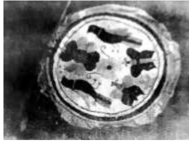
চিত্র ৬: নকশি পাখা

পাখায় নকশা অংকনে লতাপাতা, জ্যামিতিক নকশা এবং পশু পাখির বিভিন্ন মটিফ ব্যবহার করা হয়। নির্মাণ উপকরণের উপর ভিত্তি করে পাখার বিভিন্ন নামকরণ করা হয়। যেমন-সুতা দ্বারা তৈরিকৃত পাখা শঙ্কলতা, তারা ফুল, বলদের চোখ, সাগরদীঘি, বাঁশ দ্বারা তৈরিকৃত পাখা- গুলপাতা, তারাফুল, ছিটাফুল, ভালবাসা, হাতি, মানুষ এবং বেতের তৈরি পাখা পালঙ্কপোষ, পাশারদান প্রভৃতি নামে পরিচিত। ২১ এছাড়াও পাখার উপর বিভিন্ন প্রবাদ বাক্য, নীতিকথা ও ছড়া লক্ষ্য করা যায়। বস্তুত বৈদ্যুতিক পাখা আবিষ্কার হওয়ায় গ্রামীণ পাখার ব্যবহার হ্রাস পেলেও এর আবেদন একেবারে শেষ হয়ে যায়নি। গ্রামীণ নারীদের অংশগ্রহণের ফলে পাখাশিল্পী গ্রাম বাংলার মানুষের শুধু নয়, নাগরিক জীবনেও 'গরমকালের পরম পাখা' হিসেবে যেমন মর্যাদা পেয়েছে, তেমনি বাণিজ্যিকভাবেও পেয়েছে সফলতা। তবে ব্যবহারিক প্রয়োজনই চারু ও কারু শিল্পের শেষ কথা নয়। লোক-মানব সৃষ্ট এ শিল্পকর্ম নিত্যদিনের ব্যবহারিক প্রয়োজন মিটিয়েও শৈল্পিক নান্দনিকতা এবং বহুজনের ভালবাসার স্পর্শে গোটা সমাজেরই প্রতীক হয়ে উঠে।