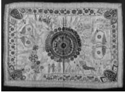
চিত্র ২: নকশি কাঁথা

পূর্বে গ্রামের নারীরা এককভাবে বা যৌথভাবে কাঁথা সেলাই করতেন। বর্তমানে বাণিজ্যিক ভিত্তিতে কাঁথা তৈরী হয়। যশোরের বিভিন্ন গ্রামাঞ্চলে এনজিও সংস্থা ব্রাকের আওতায় এ ধরনের নকশি কাঁথার বুনন পরিচালিত হয়। ব্রাক ছাড়াও যশোর সদরের 'যশোর স্ট্রিট', নকশি কাজের জন্য প্রসিদ্ধ একটি প্রতিষ্ঠান। দেশের বিভিন্ন অঞ্চলের ক্রেতাররা এখান থেকে নকশি কাঁথা সংগ্রহ করে থাকে। ১১ সুতরাং প্রাচীনকাল থেকে গবেষণা অঞ্চল হিসেবে যশোরে বাংলার অন্যান্য অঞ্চলের চেয়ে ভিন্ন রীতিতে নকশি কাঁথা শিল্পের বিকাশ ঘটেছিল যা আজও লোকজ শিল্পের অনন্য প্রতীক হিসেবে বিদ্যমান রয়েছে।