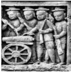
চিত্র ১১: মন্দিরের টেরাকোটা।

মৃৎশিল্পের সম্প্রসারিত রূপ হলো মাটির ফলক, এটি 'টেরাকোটা' নামে পরিচিত। পোড়ামাটির ফলক গৃহ সজ্জার উপকরণ ব্যতীত বাংলার রমণীদেও অলংকার হিসেবেও ব্যবহৃত হয়। এই ফলক বৌদ্ধ, হিন্দু ও মুসলিম সকল সম্প্রদায়ের ধর্মীয় ইমারত তথা মন্দির ও মসজিদে ব্যাপকভাবে ব্যবহৃত হয়। ১৪ ধর্মীয় ইমারতে ব্যবহৃত ফলক বাংলার লোকজ শিল্পধারার পরিচয় বহন করে। মাটির ফলক নকশার বিষয়বস্তু হলো- অর্ধ প্রস্ফুটিত ফুল, কিন্নর-কিন্নরী, দণ্ডায়মান গন্ধামীণ মানুষ, জীব-জন্তু, রাজা-রাণী, হাতি, হরিণ, ময়ূও ইত্যাদি। ধর্মীয় বিষয়ের মধ্যে শিব, বিষ্ণু, গণেশ, মঞ্জুশ্রী, তারা ও ব্রহ্ম প্রধান। এয়াড়া দৈনন্দিন জীবনের হাসি-কান্না, আনন্দ-উল্লাস, ব্যথা-বেদনা এবং জীবনধারাও পোড়ামাটির ফলকে প্রতিফলিত হয়। হিন্দু-মুসলিম উভয় স্থাপত্যে জ্যামিতিক নকশার ফলক লক্ষ্য করা যায়। ১৫ এসব ফলক নকশার মধ্যে যশোর অঞ্চলের মানুষের প্রাত্যহিক জীবনের ইঙ্গিত পাওয়া যায়। জীবন-জীবীকার অন্বেষণে যে শিল্পকর্ম বিক্রি কওে লোকজ কারু ও চারুশিল্পিরা তাতেও প্রয়োজন মিটিয়েছেন, আধুনিকতার ছোঁয়ায় তা এখন বন্ধ হওয়ার উপক্রম। তবু তারা একেবাওে থেমে যাননি। বৈশাখী মেলা, বাসন্তী মেলা, রথের মেলা ও হাট-বাজাওে এখানে যে পরিমাণ মৃৎশিল্পের দ্রব্য সামগ্রীর আগমন ঘটে তা থেকে প্রতীয়মান হয় যে, যশোরের এ শিল্পের চাহিদা ক্রমান্বয়ে বাড়ছে। তবে কাঁচামালের স্বল্পতা ও মূল্যবৃদ্ধি পাওয়ায় শিল্পিরা বাধার সম্মুখীন হচ্ছে। তবুও সমকালীন চাহিদা মিটিয়ে যশোরের লোকজ কারু ও চারু শিল্পিরা তাতেও ঐতিহ্যবাহী শিল্পীকে চিরায়ত কওে তুলবেন-এঁই প্রত্যাশা।