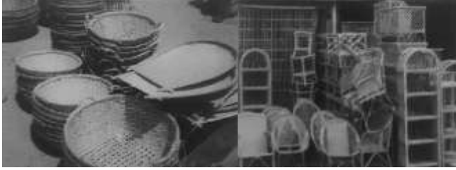
চিত্র ৭: বাঁশ ও বেতের তৈরি বিভিন্ন সামগ্রী।

কারুশিল্পের আরেকটি ধারা বাঁশ ও বেতের কাজ। কারুবৃত্তিজীবী এ শিল্পীরা সামাজিকভাবে খুই বঞ্চিত এবং এ বৃত্তি তাতেও জীবিকা নির্বাহের প্রধান উপায়। হিন্দু সম্প্রদায়ের ঋষিরা বাঁশ-বেত শিল্পের সাথে জড়িত। যশোরের নারকেল বাড়িয়া, শেখের হাট ও রামচন্দ্রপুর গ্রামে ঋষি সম্প্রদায় বসবাস করেন। এ অঞ্চলে প্রচুর বাঁশ ও বেত বাগান রয়েছে। শিল্পীরা বাঁশ দিয়ে ঝুড়ি, ডালা, কুলো, মাখাল, খাঁচা, খালই, খাদুন, পোলো, ঘুণি, চারো, ট্যাপারী ইত্যাদি তৈরি করেন। যশোরের অভয়নগর উপজেলার ভূমি নীচু হওয়ায় এখানের নদী, বিল ও জলাশয়ে প্রচুর মাছ পাওয়া যায়। ফলে এখানে বাঁশ শিল্পের ব্যবহার অধিক পরিলক্ষিত হয়। ২৪ বেত ও বেতজাত দ্রব্যেও ব্যবহার লোকঐতিহ্যকে লালন করে। বেত দিয়ে ধামা, খুচি, মোড়া, চেয়ার, ঝাপি, সাঁজি ইত্যাদি তৈরি করা হয়। এয়াড়াও লোকবাদ্য যেমন- ঢোল, তবলা, একতারা, দো-তারাসহ বিভিন্ন উপকরণে বেতের ব্যবহার হয়।