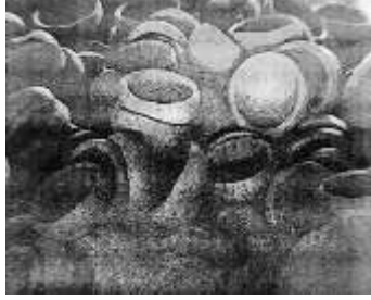
চিত্র ১০: মৃৎপাত্র।

পার্বণে রং তুলি দিয়ে সৌন্দর্যের ডালি সাজানো হয়। বাঘারপাড়া উপজেলেরা দিয়াপাড়া, আন্দোলন বাড়িয়া, দোহাকুলো ও দরাজহাট গ্রামে পাল বংশের লোকেরা বসবাস করেন। তারা দীর্ঘকাল ধরে বংশ পরম্পরায় এই ঐতিহ্যবাহী শিল্পের সঙ্গে যুক্ত রয়েছেন। মৃৎশিল্পের ব্যাপকতা লক্ষ্য করা যায় যশোরের অভয়নগর উপজেলার পালপাড়া, পাকের গাতি, চালশিয়া প্রভৃতি গ্রামে। একসময় যশোর শহরে পালদের কর্মতৎপরতা বিদ্যমান ছিল। আজও যশোর শহরে পাল বাড়ির মোড় নামে একটি প্রসিদ্ধ স্থান রয়েছে। যাহোক বর্তমানে এ শিল্পীদের সংখ্যা ক্রমান্বয়ে হ্রাস পাচ্ছে। শিল্পিরা এ পেশা ত্যাগ করে অন্য পেশা গ্রহণ করছেন। ফলে মৃৎশিল্পের প্রাচীন ঐতিহ্য হারিয়ে যাচ্ছে।