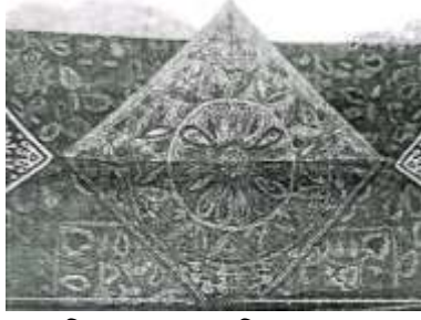
চিত্র ৪: সোফার পিলো কভার