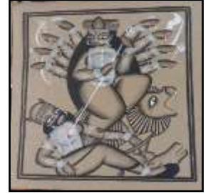
চিত্র নং-৫ দুর্গা মোটিফ

লক্ষ্মী: দেব-দেবীকেন্দ্রিক মোটিফের মধ্যে সবচেয়ে উল্লেখযোগ্য মোটিফ হল দেবী লক্ষ্মী। দেবী লক্ষ্মীর পূর্ণ আকৃতি এছাড়া লক্ষ্মীর পদচিহ্ন, লক্ষ্মীর বাহন পেঁচা, ধানের শীষ ইত্যাদি ও লক্ষ্মীর প্রতীক রূপে আঁকা হয়। লক্ষ্মী ধন সম্পদের দেবী। তাই ধন-সম্পদের আকাঙ্ক্ষা থেকে লক্ষ্মী চিত্র অঙ্কন করা হয়। আলপনা সরা চিত্র পটচিত্রের লক্ষ্মীর পূর্ণ মূর্তি এবং বিভিন্ন প্রতীকের চিত্র দেখা যায়। সরাচিত্র পটচিত্র প্রভৃতিতে লক্ষ্মীর মূর্তি আঁকা হয়। এক্ষেত্রে লক্ষ্মীর বাহন পেঁচা ধানের ছড়া ও থাকে আবার আলপনার ক্ষেত্রে লক্ষ্মীর পূর্ণমূর্তি থাকে না তবে পেঁচার চিত্র, লক্ষ্মীর পা, ধানের ছড়া ইত্যাদি চিত্র দেখা যায়।