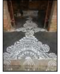
চিত্র নং-১ কলকা মোটিফ

লোকচিত্রকলার বিভিন্ন আঙ্গিকে মোটিফ হিসাবে যে সমস্ত বিষয়গুলি লক্ষ্য করা যায় সেগুলি হল - বিভিন্ন গাছ, পদ্ম, গোলাপ ও অন্যান্য লতানো ফুল, পাখি, লতা-পাতা, হাতি, ঘোড়া, বিভিন্ন দেব-দেবী, ময়ূর, মোরগ কলাগাছ, ধানের শীষ, ধানছড়া, লক্ষ্মীর পা, কলকা, বিভিন্ন জ্যামিতিক নকশা, দেবদেবী, লক্ষ্মী, রাধাকৃষ্ণ প্রভৃতি। এই সমস্ত মোটিফগুলির পরিপ্রেক্ষিতে আমরা মোটিফগুলিকে আলোচনার সুবিধার্থে কয়েকটি বিষয়কেন্দ্রিকভাবে ভাগ করে নিয়েছি। যেমন: