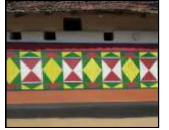
চিত্র নং-৪ জ্যামিতিক মোটিফ

বাংলার লোকচিত্রকলায় বিভিন্ন দেবদেবীর মোটিফ লক্ষ্য করা যায়। হিন্দু সম্প্রদায়ের মানুষের দেবতার প্রতি ভক্তি ও বিশ্বাসের কারণেই লোকচিত্রকলায় দেব-দেবী চিত্র অঙ্কনের প্রবণতা দেখা যায়। মূলত সাধারণ মানুষ তাদের মনের কামনা বাসনা, আকাঙ্ক্ষা প্রকাশ করে থাকে চিত্রের মধ্য দিয়ে বিভিন্ন দেব-দেবীকে পূজো করার সঙ্গে থাকে বিভিন্ন