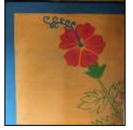
চিত্র নং-২ জবাফুল

গোলাপফুল: গোলাপফুল দেওয়ালচিত্রের একটি পরিচিত মোটিফ। গোলাপফুল সৌন্দর্য ও ভালোবাসার প্রতীক। দেওয়ালগায়ে ফ্রেসকো ও রিলিফ এই দুই পদ্ধতিতে গোলাপফুল আঁকতে দেখা যায়। অনেক সময় রিলিফ শ্রেণীর দেওয়ালচিত্রের ওপর রং করা হয়।