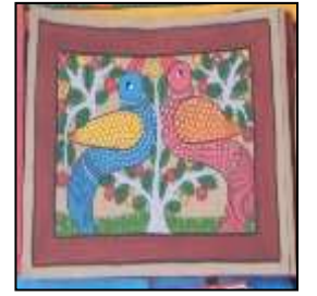
চিত্র নং-৩ পটচিত্রে টিয়া

ময়ূর: লোকচিত্রকলার একটি বিশেষ মোটিফ হল ময়ূর। দেওয়ালচিত্রে জোড়া ময়ূরের ছবি দেখা যায়। তবে মুখোমুখি ময়ূরের চিত্র বেশী দেখা যায়। আমরা জানি ময়ূর সৌন্দর্যের প্রতীক। আবার ময়ূর সাপ ভক্ষণ করে। সুতরাং আমার ধারণা দেওয়াল সৌন্দর্য বৃদ্ধির সঙ্গে সঙ্গে আদিবাসীরা জঙ্গলে সাপের উপদ্রব থেকে রক্ষা পাওয়ার জন্য প্রতীকার্থে ময়ূরের চিত্র অঙ্কন করে।