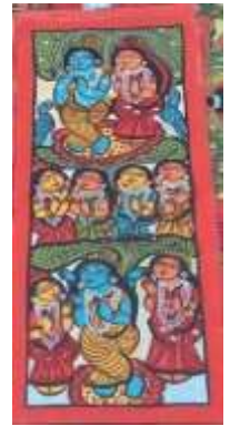
চিত্র নং-৬ রাধাকৃষ্ণ

রাধাকৃষ্ণ: হিন্দু ধর্মের মানবসমাজে রাধাকৃষ্ণের গুরুত্ব অপেক্ষাকৃত অধিক। রাধা ও কৃষ্ণের প্রেম কাহিনি ভীষণভাবে প্রচলিত এবং বাংলা সাহিত্যের গুরুত্ব রয়েছে। লোকসংস্কৃতির আঙ্গিক লোকসংগীতেও রাধা কৃষ্ণের প্রসঙ্গ পাওয়া যায়। পটচিত্রের, সরাচিত্রে রাধাকৃষ্ণের চিত্র দেখতে পাওয়া যায়। সরাচিত্রে লক্ষ্মীনারায়ণ নামে প্রচলিত। রাধাকৃষ্ণের আলাদাভাবেও চিত্র দেখা যায়। প্রেমলীলার কাহিনি থাকে এছাড়া পুঁথি ও পাঠা চিত্রে যে চিত্র থাকে সেখানেও রাধাকৃষ্ণের কাহিনীর চিত্রই অধিক দেখা যায় (চিত্র নং-৬)।